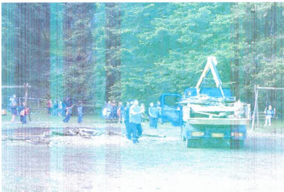
Συνεργείο εργαζομένων της Πολιτικής Προστασίας του Δήμου συλλέγει τα κομμάτια από το ξύλινο κiosk του κεντρικού Πάρκου του Εθνικού Δρυμού Αίνου.