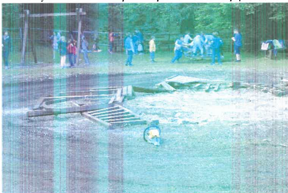
Λίγο πριν την ολοκλήρωση της συλλογής των σπασμένων υποδομών.