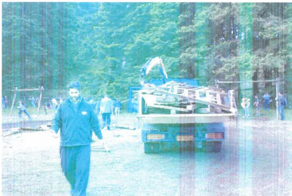
Συλλογή των σπασμένων υποδομών με την συμβολή και του προσωπικού του Φορέα Διαχείρισης.