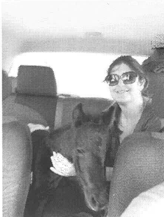
Μεταφορά του ζώου από το Προσωπικό Φύλαξης για περίθαλψη σε κτηνιατρείο της Σάμης.