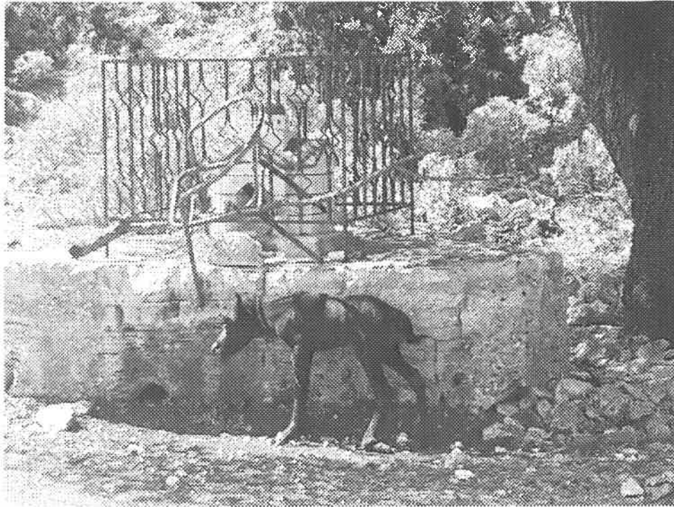
Το μικρό άλογο, όπως βρέθηκε από το προσωπικό Επόπτευσης/Φύλαξης του Φορέα Διαχείρισης στην περιοχή της Ι.Μ. Ζωοδόχου Πηγής Αίνου.